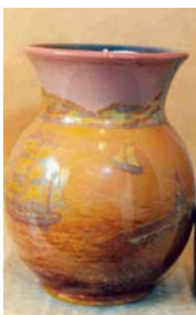
5. “El gerro Vilanova” (1958), Museu de Ceràmica de Barcelona (ref. 100874), 28,3 x 23 ø cm.