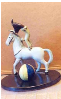
1. Equilibrista (1927) 31'5 x 26 cm