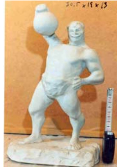
3. “Gerro Tirant l’art”, 20 x 17 cm.