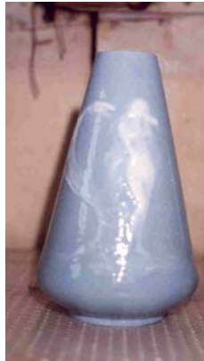
2. “Gerro de les muses o de les arts”, Museu de Ceràmica de Barcelona, 22 x 10 cm.