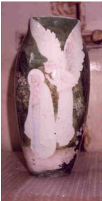
1. “Anunciació”, 32 x 16 cm