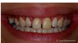
Dientes de porcelana