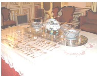
Comedor, planta primera